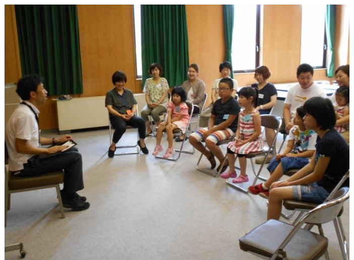
〈ジェスチャーゲームの説明を聞いているところ〉

異年齢の集団の集まりでしたが、同じ障害のある友達と会うよい機会でもあり、参加された保護者の方々からも「またこのような機会を」との声をいただきました。ご参加いただきありがとうございました。