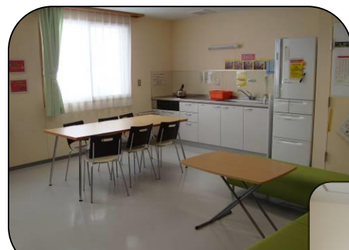
【ホール】 冷蔵庫、テレビ等