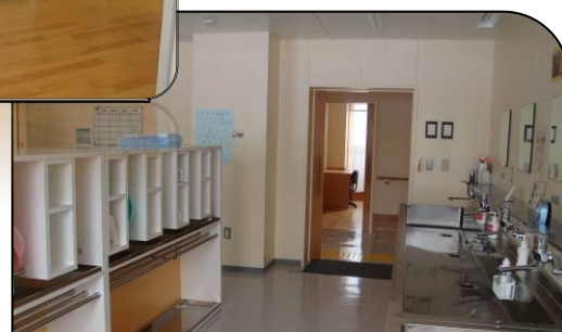
【洗面所】 洗濯機、乾燥機設置