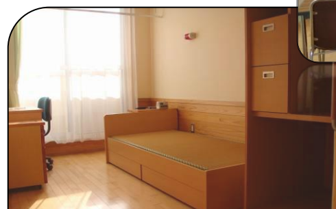
【舎室】 一人部屋、二人部屋、バリアフリー室