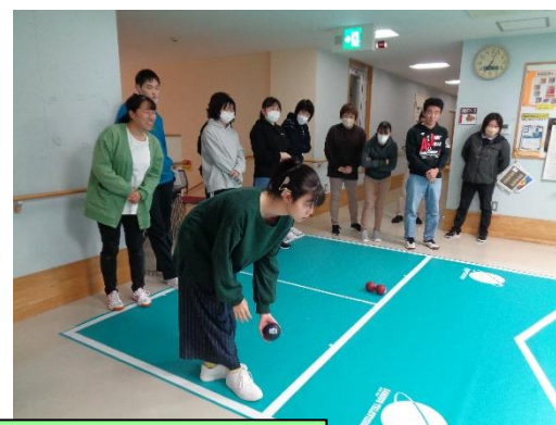
合同余暇活動(ボッチャ)