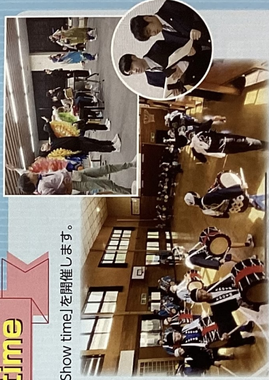
写真は昨年度の様子