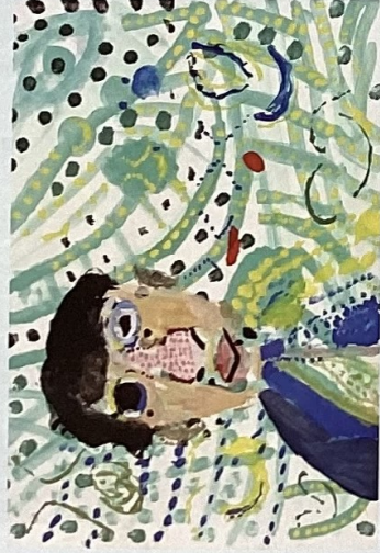
R5年度受賞作品 [絵画]