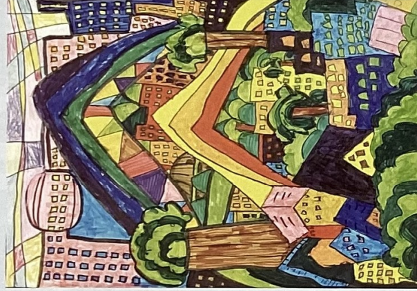
R5年度受賞作品 [絵画]