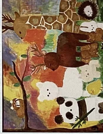
R5年度受賞作品 [自由作品]