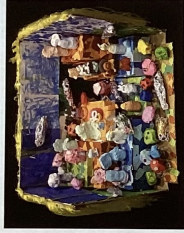
R5年度受賞作品 [自由作品]