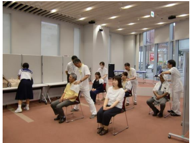
「ふれあいマッサージ」コーナー 施術の様子