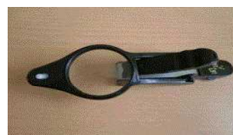
【LEDルーペ付き爪切り】

今回は視覚サポート商品を二つ紹介したいと思います。一つ目は、すでに使われている方もいると思いますが「LEDルーペ付き爪切り」です。明るく照らされ、大きいルーペで刃先がよく見えるため、爪切りがしやすいです。二つ目は、iPad や iPhone の拡大機能やカメラ機能です。爪切りをする時や文字を拡大したり、鏡に使ったりすることのできる便利グッズです。皆さんも使ってみてはいかがでしょうか?