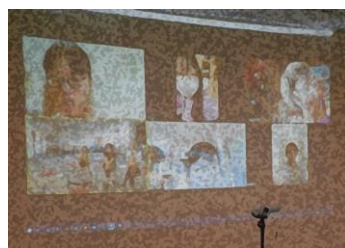
Zoomを使ってオンラインで交流

旧担任も交えながら、最近の出来事、進路先での悩みなどを、参加者同士で話しました。学生時代に一緒に勉強した仲間だからこそ、話せること、話したいこともたくさんあったようです。