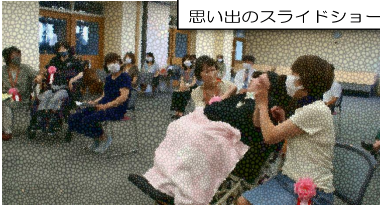
思い出のスライドショー

7月30日(土)の午前中に本校2階会議室で「二十歳を祝う会」が行われました。昨年度までは、「成人を祝う会」という名称でしたが、法改正による成人年齢の変更に伴い、二十歳の区切りをお祝いする会になりました。コロナウイルス感染症の影響もあり、対象となる令和2年度の卒業生の参加は二人でしたが、音楽と一緒に楽しむ時間などの在学中を思い出す活動もあり、大変楽しい会となりました。