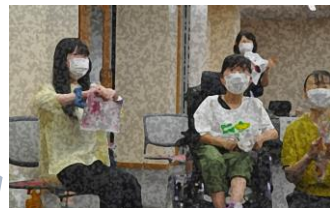
身近な物を使って、みんなで演奏