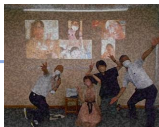
参加者全員で記念撮影