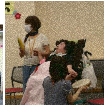
復活！ クラス de ミュージック