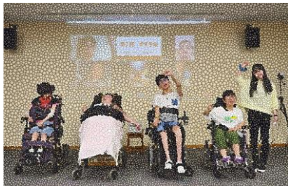
オンライン参加した同窓生と一緒に記念撮影

学校を会場に実施しました。同窓生の皆さんは、久しぶりに来校できたことを、とても喜んでいました。楽器演奏やボディパーカッション、イントロクイズなどを楽しみました。学生の頃と同じように授業に参加し、表現活動を楽しんでいました。